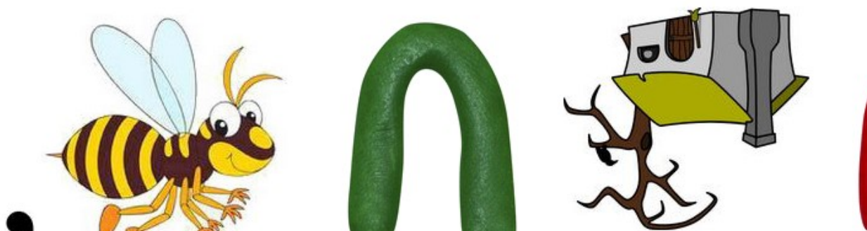
Рис. 1. Завдання станції «Кулінарна» (Ребус згенерований на онлайн-платформі http://rebus1.com/ )

На станції «Модний стиль» пропонується долучитися до ігрової вправи «Козацька мода в XIV-XVI ст.», яка розроблена на шаблоні сервісу LearningApps.org (рис. 2), та за умови успішного виконання прочитати прислів'я.