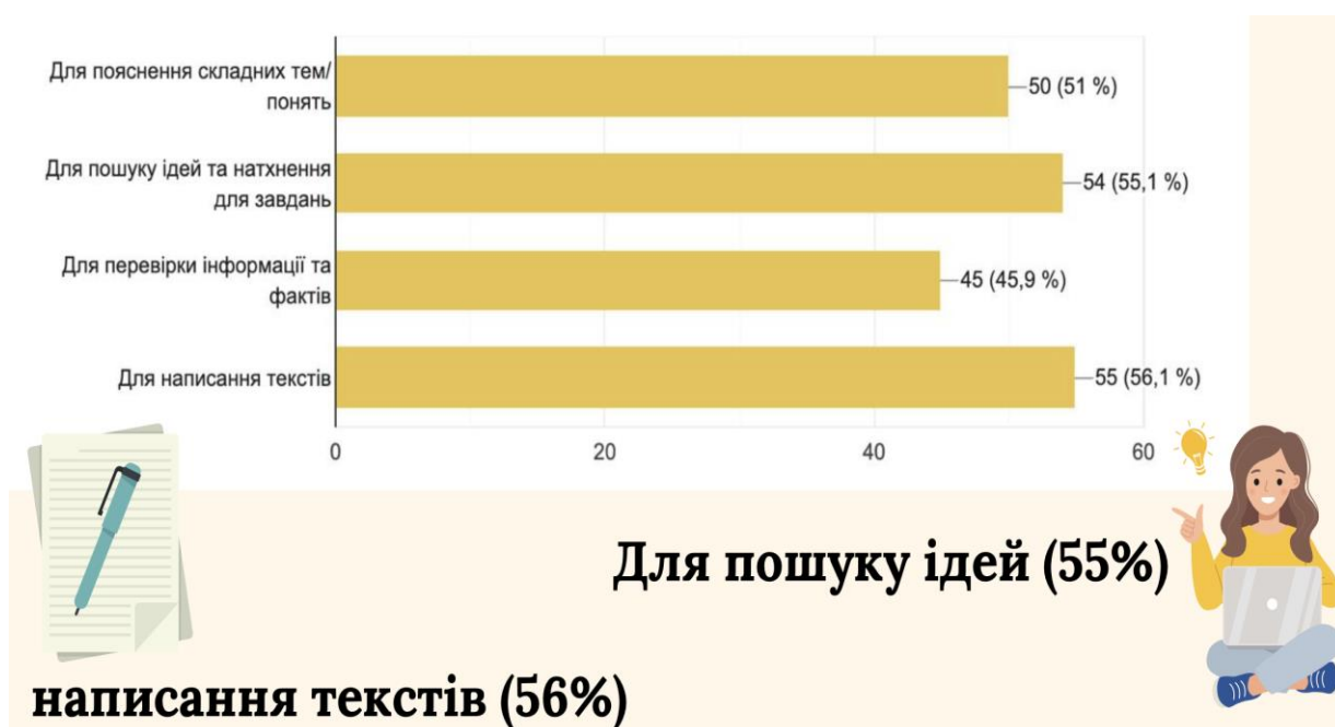
Рис.1 Інфографіка цілей використання ChatGPT українськими студентами та школярами за результатами вибіркового спостереження.