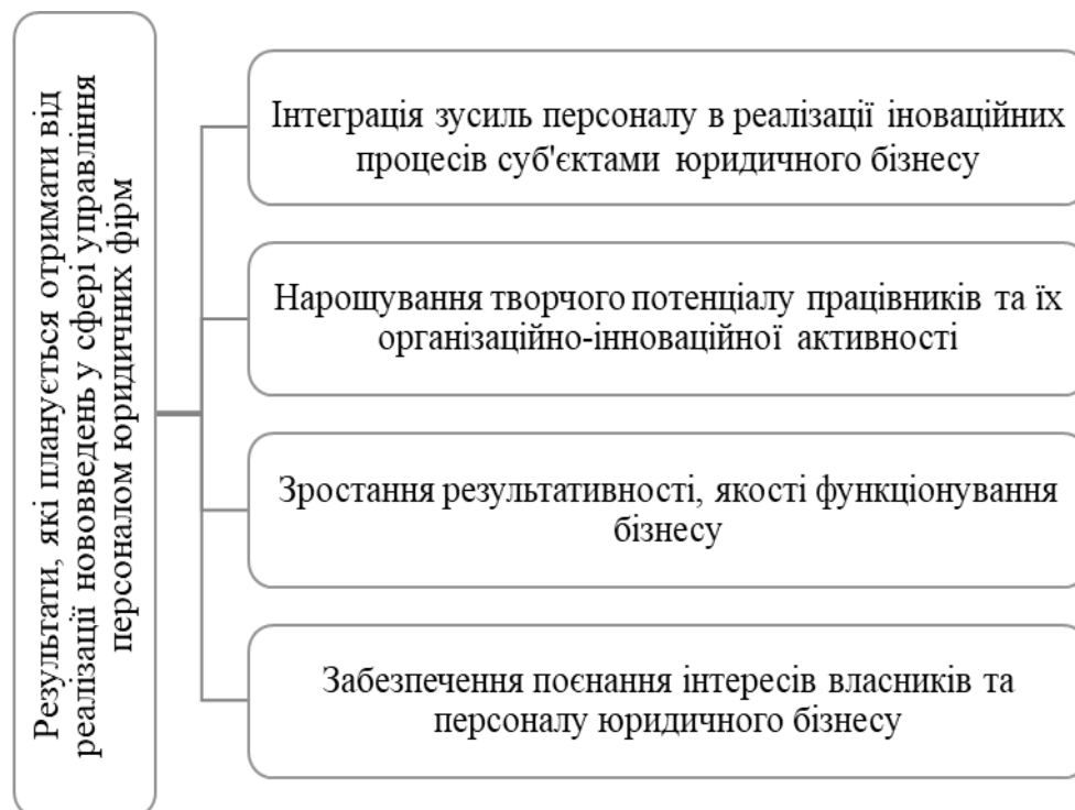
Рисунок 1. Результати, які планується отримати юридичними фірмами від реалізації нововведень у сфері управління персоналом (сформовано авторами)

Результати, які можуть бути отримані юридичними фірмами від реалізації нововведень у сфері управління персоналом, наведені на рис. 1.